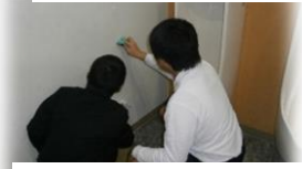
トイレ・階段の壁の汚れ落とし