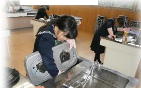
コンロ・流し磨き