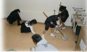
体育館2階物置の汚れ落とし