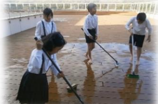
ウッドデッキのお掃除