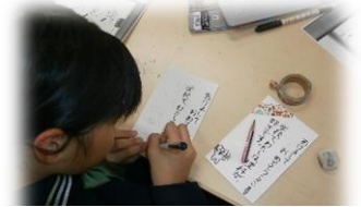
独居老人への年賀状作成